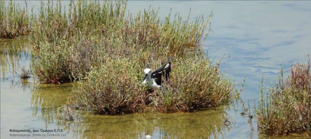
Καλαμοκάνος Kalamokanas