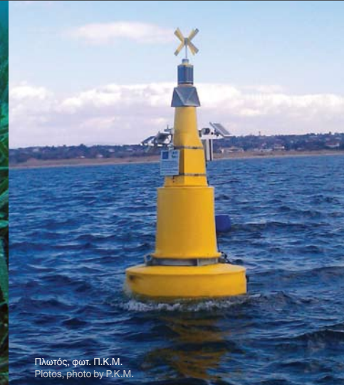
Πλωτός Plootes