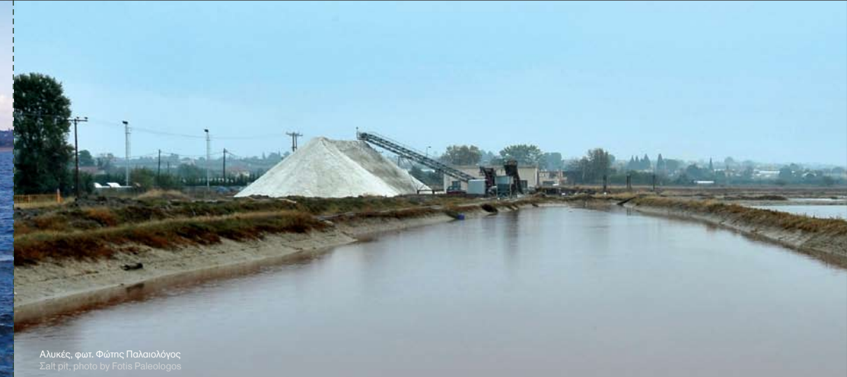
Αλικές, φωτ. Φώτης Παλαιολόγος Salt pit, photo by Fotis Paleologos