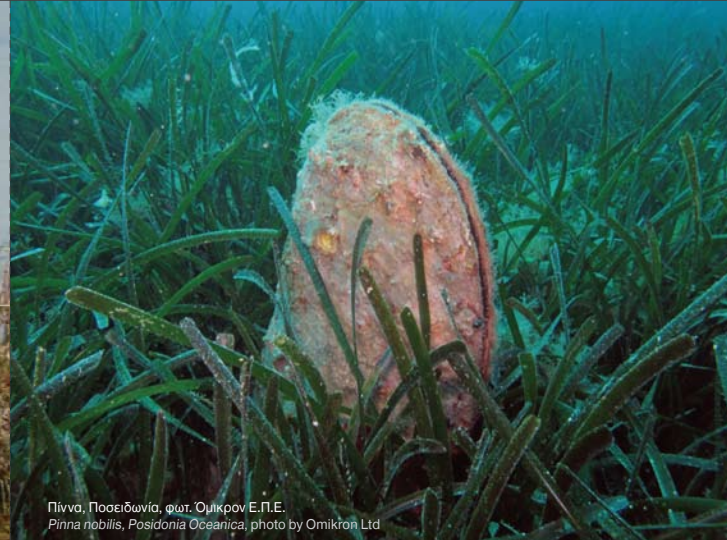
Πίννο, Ποσειδωνία, φωτ. Ομικρον Ε.Π.Ε. Pinna nobilis, Posidonia oceanica, photo by Omikron Ltd